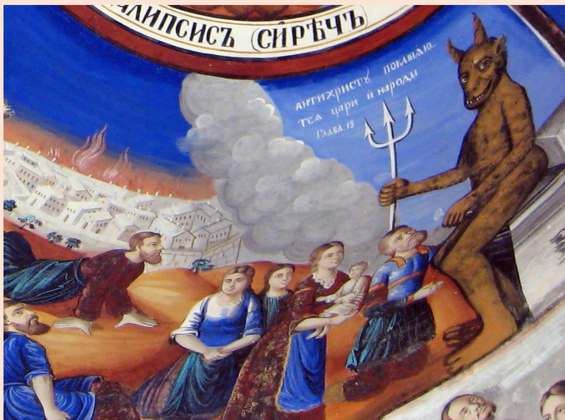
El Anticristo. Cuadro de Luca Signorelli, renacentista.